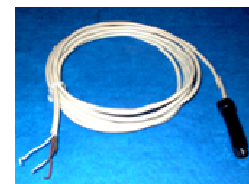
Füllstands- Überwachungs- sensor